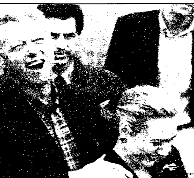
الرئيس الأميركي بيل كلينتون يطلق ضحكة من الأضواء ويرتدي كفت زيجته هيلاري بينما يتمايلان لغامرة جزيرة مارتن فيرناند التابعة لولاية ماساتشوستس حيث حضرا حفل زفاف نجمي السنما تيد دالسون بيل مسيل شتيرز، التلفزيوني وماري ستينبرجن أحد الأصقاء الصميين الرئيس وروجه، ويبدو أن هذه الزيارة للجزيرة انتهت بسلام لكليتون، علماً بأنها قضت على الطرح الرئاسي للسائير أورد كيني بعد حادثة «تشانباكيوك» (أب)

لندن - والشرق الأوسط برزت الولايات المتحدة يوم أمس الفائزة الحقيقية وروسيا بنصف خسارة بينما خرجت إيران بخسارة كاملة عندما أختارت مجموعة شركات دولية خطين لأكابيم النفط لنقل نفط بحرقوزين وقرقستان وأسيا الوسطى إلى الأسواق العالمية. وبناء عليه، ستصبح قرقستان وأسيا الوسطى ثاني أكبر المصدرين للنفط في العالم بعد منطقة الخليج في العقد المقبل. وكان قد توصل إلى الصفقة بعد مفاوضات هاتفة جرت بين الرئيس الأميركي بيل كلينتون وروساء روسيا